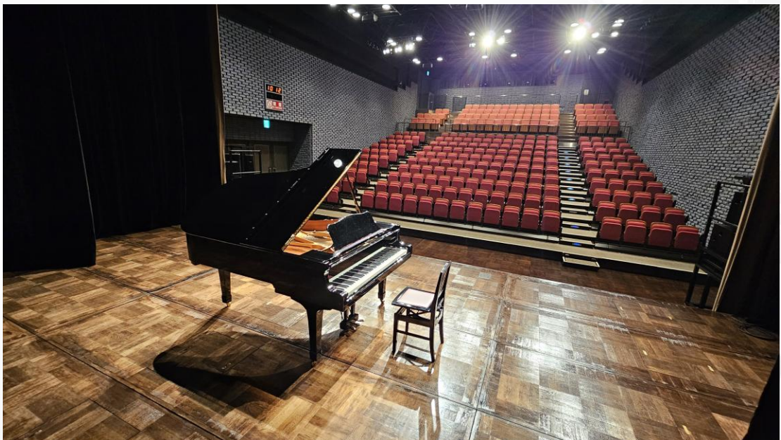
写真の客席は274席です