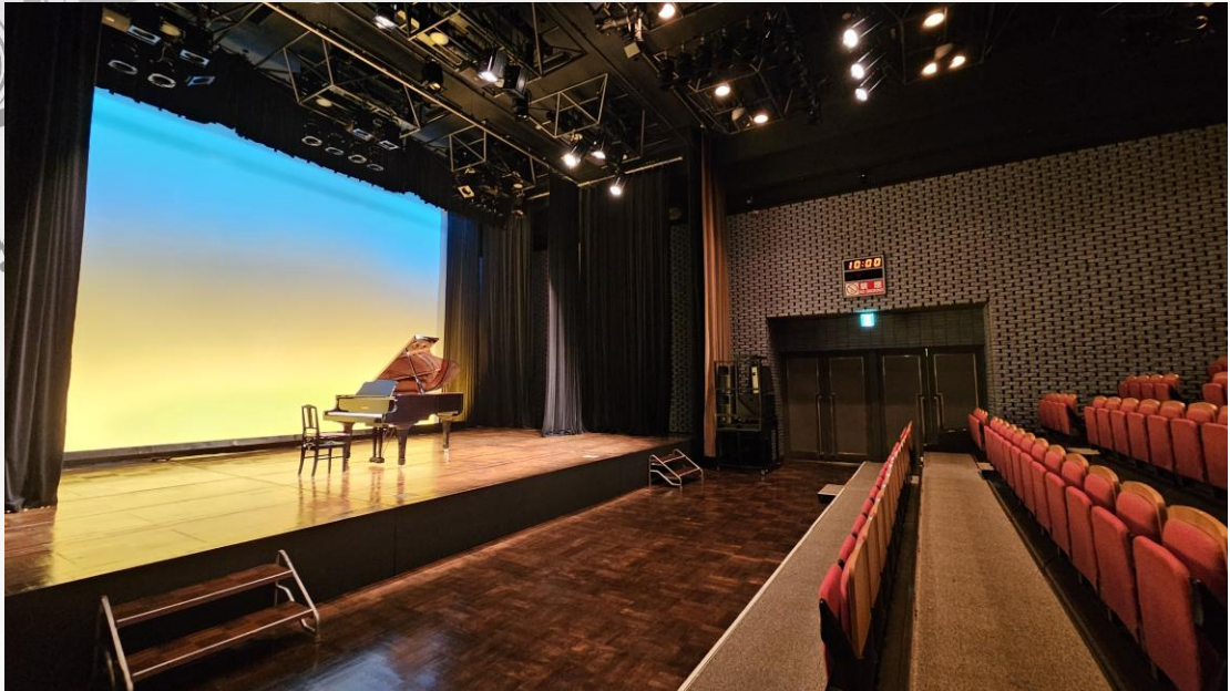
写真のピアノはヤマハC5です

ピアノはスタインウェイとヤマハの2種類 オーソドックスな形式の発表会におすすめです